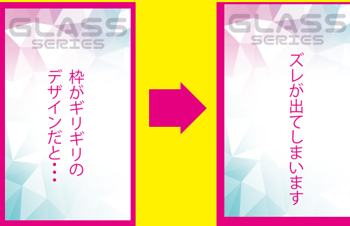
枠のあるデザイン例

同系色のデザインを重ねた場合、同化する可能性があります。 細かいデザインの場合、擦れたり、潰れたいする場合があります。 (罫線は最低0.2mm以上、文字は細い書体なら 4 pt以上)